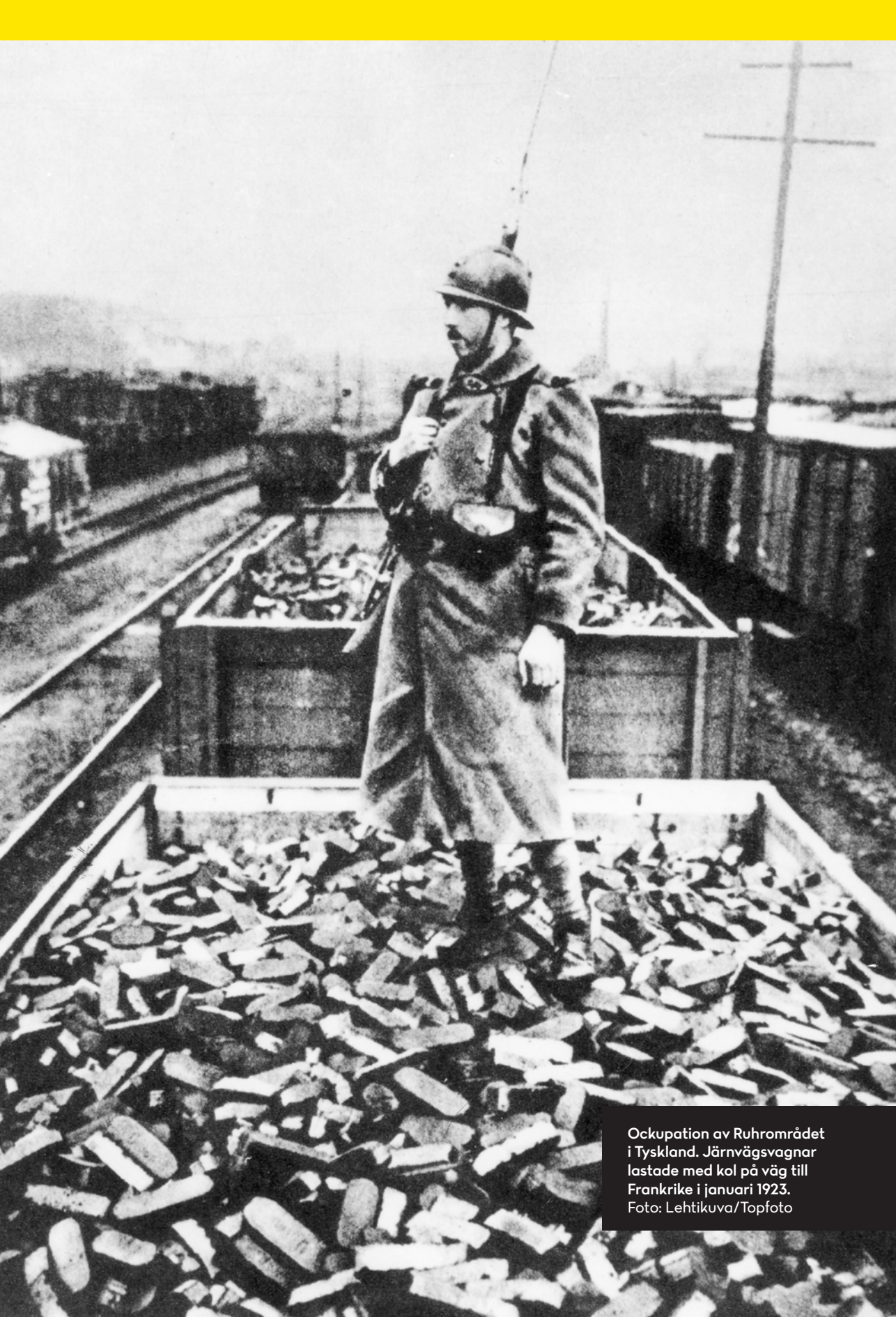
Ockupation av Ruhrområdet i Tyskland. Järnvägsvagnar lastade med kol på väg till Frankrike i januari 1923.